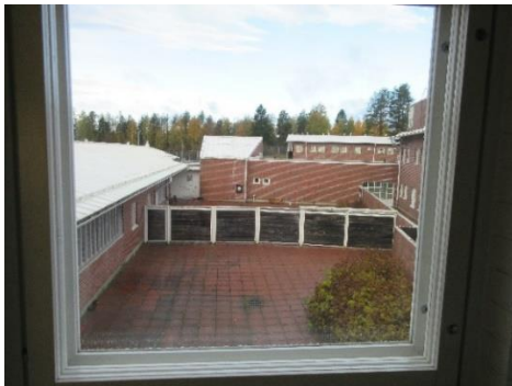
Erillään ulkoilevien ulkoilupiha

Ulkoilutiloja on kolme – miesten, naisten ja erillään ulkoilevien ulkoilutilat. Ulkoilutilat ovat avaria ja hyvän kokoisia. Miesten ulkoilutilassa on painonnostovälineet. Ulkoilutiloissa ei ole sadekatoksia, mutta vangeilla on mahdollisuus käyttää sadetakkeja. Miesten ulkoilutilaan ollaan suunnittelemassa sadekatosta.