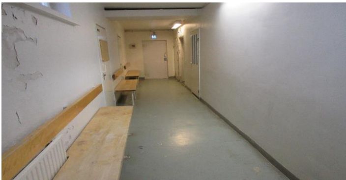
Näkymä eristystilojen käytävältä

Vankilassa on kaksi eristysselliä, jotka sijaitsevat kellarikerroksessa (kaikki kuvat otettu sellistä E2).