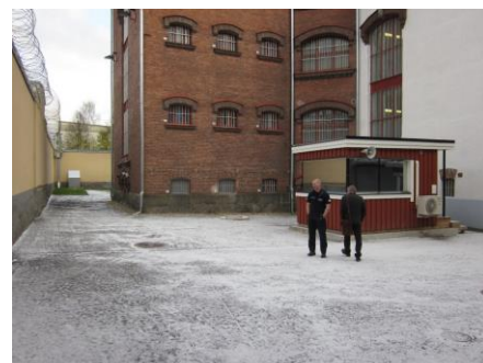
Vanhan puolen läntinen ulkoilupiha

Erillään pidettäviä varten on oma ulkoilutilansa lisärakennuksessa. Ulkoilutila on kooltaan noin 40 neliötä. Tila on kuin kerrostalon yksiö, jonka yksi seinä on osittain poistettu ja korvattu se kaltereilla. Tila on erittäin karu, eikä siellä ole varusteita kuten penkkejä tai kuntoilulaitteita. Liikuntatiloista tehdyistä huomioista tarkemmin kohdassa 8.13.