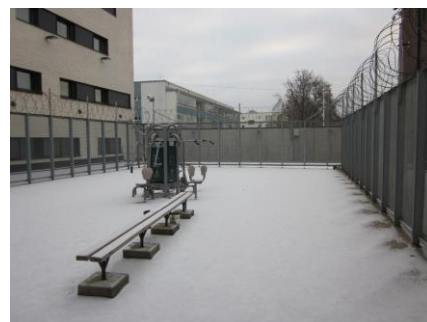
Uuden puolen itäpuolen ulkoilupiha

Ulkoilutiloja on neljä, kaksi lisärakennuksen uudella puolella kooltaan 239 neliötä ja 164 neliötä ja kaksi vanhalla puolella kooltaan 275 neliötä ja 231 neliötä. Vankilan vieressä olevista asuintaloista näkyy uuden puolen molempiin ulkoilutiloihin. Vanhan puolen ulkoilupihat ovat vähäisessä käytössä ja valtaosa vangeista ulkoilee uuden puolen betonipohjaisissa ulkoilutiloissa. Ulkoilutiloissa ei ole sadekatoja. Ulkoilutiloissa on kehon omalla painolla toimiva monitoimikuntoilulaite.