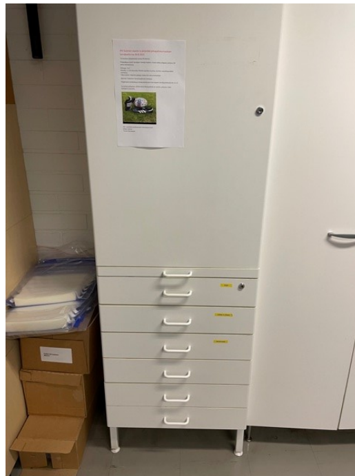
Kuva 2: Valvomotilassa oleva lääkekaappi

Vapautensa menettäneiden lääkkeitä säilytetään valvomotilassa olevassa lukitussa kaapissa. Kaappi oli lukittuna tarkastushetkellä. Kaikki vartijat ovat tarkastuksella saadun tiedon mukaan käyneet lääkkeenjako-ohjelmassa. Lääkäri annostelee lääkkeitä doseihin, joista vartijat jakavat lääkkeitä. Poliisivankilassa on käytössä erillinen lääkekirja, johon vartijat kirjaavat annetut lääkkeet.