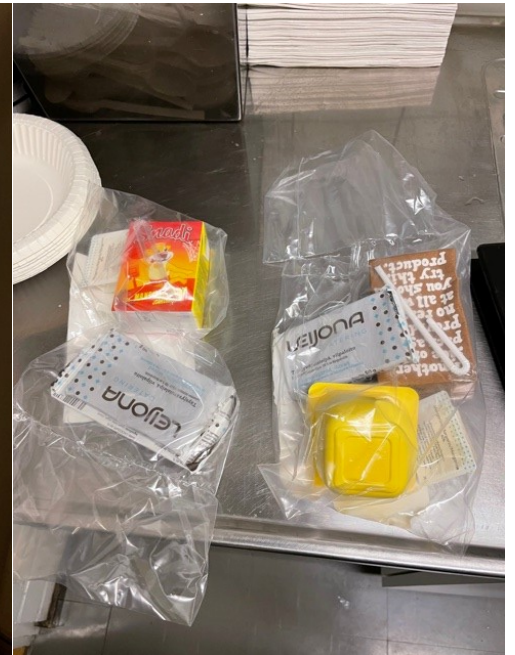
Kuva 6. Hätävara-annos

Suihkutilojen havaittiin olevan varsin puhtaassa kunnossa.