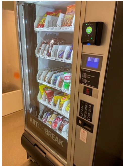
Kuva 5: Ateria-automaatti