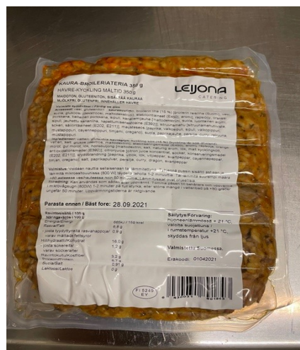
Kuva 3: Vakuumpakkaus

Säilytystiloissa tarjottavan ruuan toimittaa Leijona Catering. Ruoka-annokset tulevat vakuumpakkauksissa ja ne lämmitetään sirkulaattorilla vesihauteessa. Tarjolla on viisi eri ateriavaihtoehtoa, joten aina neljän päivän välein ateriakierto alkaa alusta. Vapautensa menettäneille tarjotaan aamiainen, lounas, päivällinen ja iltapala. Erityisruokavaliota (esim. terveydellisistä tai uskonnollisista syistä) noudattaville on saatavilla heille soveltuvaa ruokaa joka päivä, myös viikonloppuisin.