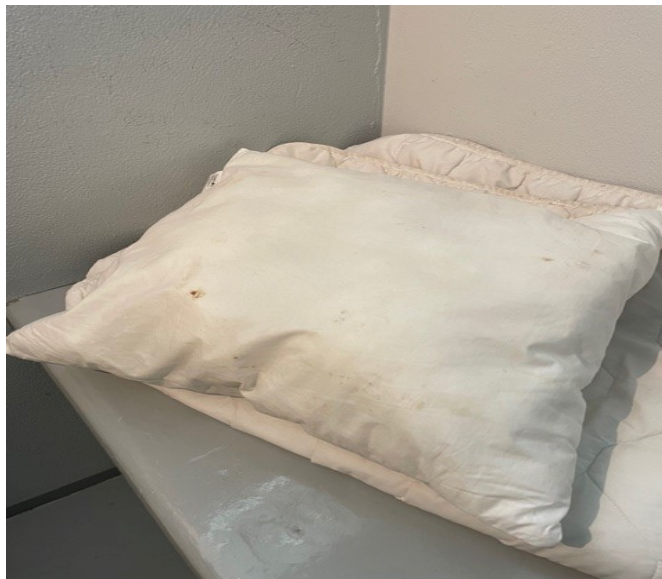
Kuva 8: Tynny ja peitto tarkastetussa sellissä

Tutkintavankien käytössä on kankaiset pussilakanat ja tynnyliinat.