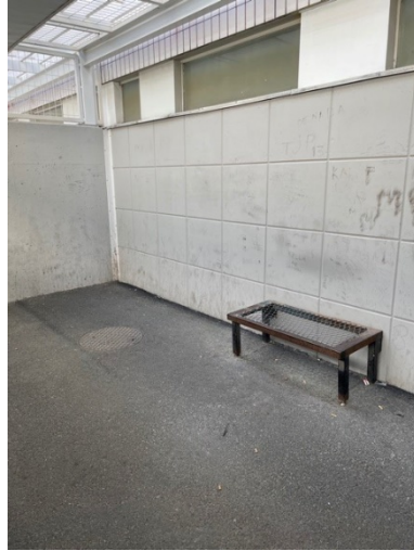
Kuva 1: Ulkoilutila

Sisätiloissa ei saa tupakoida vaan tupakointi tapahtuu ulkoilutiloissa ja päivittäisen ulkoilun yhteydessä (kerran päivässä).