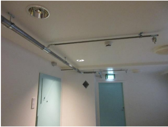
Kuva 3. palosammutinjärjestelmän putkisto

Metsärinteessä oli katon rajassa näkyvillä palosammutusjärjestelmäputket pintavetona, kuullun mukaan niitä ei ollut muuten mahdollista asentaa jälkikäteen. Tarkastajat pitivät näkyvää putkistoa huonona asiana, mutta henkilökunta kertoi, että asiakkaat eivät olleet koskeneet putkiin.