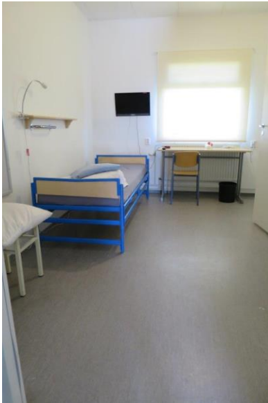
Kuva 8: inva-selli

Inva-sellin oviaukko oli 90 cm leveä ja kynnyks oli noin 35 mm korkea. Inva-sellin rakentamisen aikaan voimassa olleen rakentamismääräyskokoelman F1 määräyksen 2.1.2 mukaan kynnyks saa olla enintään 20 mm korkea. Esteettömyysasetuksen, joka tuli voimaan 1.1.2018, 4 §:n 3 momentin mukaan oven yhteydessä ei saa olla tasoeroa tai kynnyksiä, ellei se ole ääni-, kosteus- tai muiden vastaavien olosuhteiden vuoksi välttämätöntä. Tällöin kynnyks tai tasoero saa olla enintään 20 millimetriä korkea, ja kynnyks on muotoiltava siten, että sen voi helposti ylittää pyörätuolilla ja pyörillä varustetulla kävelytelineellä.