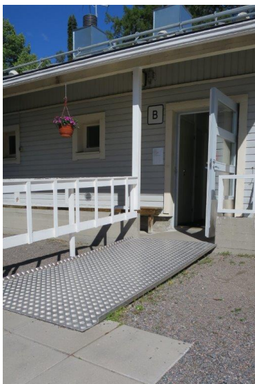
Kuva 6: Luiska rakennukseen

Vankilan johdon mukaan avovankilassa pyritään varautumaan siihen, että Inva-selli olisi aina tarvittaessa sellaisen henkilön käytettävissä, joka sitä tarvitsee. Usein tieto liikkumisesteisestä vangista tulee etukäteen, joten inva-selli voidaan varata tähän käyttöön.