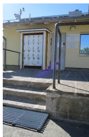
Kuva 2: Sisäänkäynti/turvatarkastus