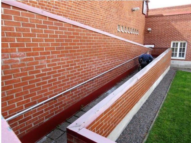
Kuva 3: Luiska suljetun vankilan vierailutiloihin

Suljetun vankilan puolella valvottuihin tapaamisiin vierailijat pääsevät esteetöntä reittiä. Tapaamistiloihin johtaa pitkä luiska, jonka alkuosa on kuitenkin melko jyrkkä. Tapaamistilan yhteydessä on inva-wc.