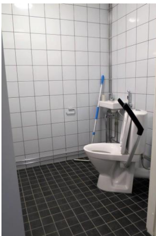
Kuva 9: inva-sellin wc

Keskusteltiin sängyn soveltuvuudesta (leveys, korkeus, patja) liikuntaesteiselle henkilölle. Vammainen henkilö voi tarvita esimerkiksi leveämmän sängyn, jotta pääsee kääntymään tai erikoispatjan ehkäisemään painehaavaumia. Todettiin, että nämä yksilölliset erityistarpeet ja mahdolliset mukautustoimet tulee selvittää vammaisen vangin kohdalla. Vankilan johdon mukaan tarvittavat erikoisjärjestelyt ja hankinnat tehdään aina yksilöllisesti, kun tilanteessa on ensin saatu terveydenhuollon puoltava lausunto / suositus.