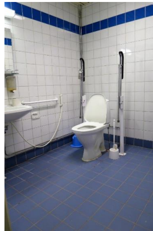
Kuva 4: Inva-wc

Avovankilaosastolla liikkumisesteisten vankien valvottuja tapaamisia on järjestetty avovankilan ruokalassa, jonne pääsee esteetöntä reittiä.