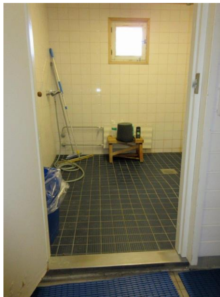
Kuva 12: Saunan kynnyks