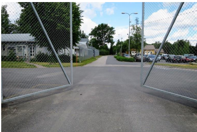
Kuva 1: Suljetun vankilan portti

Sisäänkäynti suljetun vankilan puolelle tapahtuu portin vieressä olevasta ovesta, jossa on korkeahko kynnyks liikkumisen apuvälineitä käyttävälle henkilölle. Oven vieressä on ovisummeri, joka on sijoitettu korkealle pyörätuolia käyttävälle henkilölle. Vartijoiden kertoman mukaan liikkumisen apuvälinettä käyttävä henkilö päästetään sisään isosta portista, jota kautta kulku suljetun vankilan pihalle on esteetön. Liikkumisesteiset henkilöt tarkistetaan erillisellä käsikäyttöisellä metallinpaljastimella.