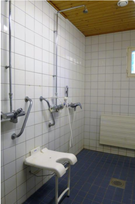
Kuva 10: Yhteisessä suihkuhuoneessa oleva suihkuistuin

Tarkastuksella havaittiin, että liikuntaesteiselle henkilölle tarkoitettu suihkuistuin oli sijoitettu epätarkoituksenmukaiseen paikkaan. Suihkuistuin oli kiinnitetty seinään kahden kiinteän suihkun väliin niin, ettei näitä katossa olevia kiinteitä suihkusuuttimia pystynyt istuen hyödyntämään. Käsisuihku taas oli niin kaukana suihkuistuimesta, ettei sitä pystynyt käyttämään asianmukaisesti. Todettiin, että suihkuistuin on mahdollista sijoittaa toimivampaan ja saavutettavampaan paikkaan suihkuhuoneessa. Vankilan johdon ilmoituksen mukaan suihkuistuin tullaan siirtämään toiminnallisesti parempaan paikkaan.