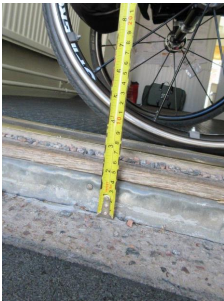
Kuva 11: Ulko-oven kynnyks n. 70 mm

Käydyssä keskustelussa vankilan johto totesi, kynnyksien ylitystä helpottamaan voidaan hankkia tai rakentaa luiskat (mahdollisesti siirrettävät).