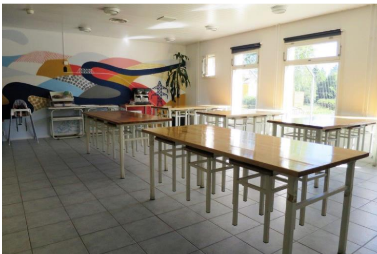
Kuva 5: Avovankilaosaston ruokala

Avovankilaosastolla liikkumisesteisten vankien valvottuja tapaamisia on järjestetty avovankilan ruokalassa, jonne pääsee esteetöntä reittiä.