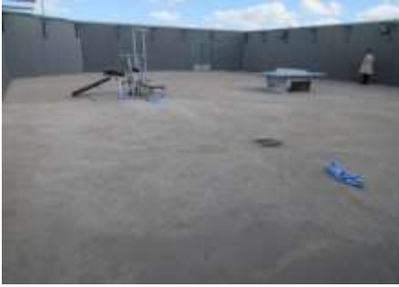
Sellirakennuksen katolla oleva ulkoilupiha

Tarkastushavaintoina, vankien kanssa keskusteltaessa ja kanteluasioissa ovat ongelmakohtina tulleet esiin sadekatosten/aurinkosuojan puuttuminen, wc-tiloihin pääsy, kesken ulkoilujan poistuminen sekä talvikäyttöön soveltuvien päällysvaateiden haltuun antamatta jättäminen. Useat vangit valittivat lämpimien vaatteiden puutetta, koska vankilassa ei anneta vuorellisia talvivaatteita tai huppareita haltuun.