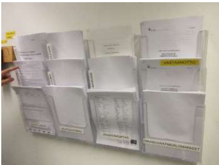
Kuva vastaanotto-osaston sellikäytävän seinältä

Vankilasta tarkastuksen jälkeen saadun tiedon mukaan vankeuslain ja tutkintavankeuslain englanninkieliset käännökset ovat saatavilla kirjastossa ja lisäksi ne ovat kesäkuussa olleet sidottavina vankilan kirjansitomossa, mistä ne toimitetaan kaikille osastoille.