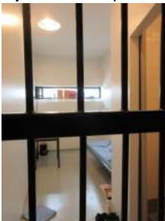
Kuva: Sellissä ei ole säilytystila tai säilytyskalustetta. Ikkuna on normaalia asuinselliä pienempi.

Lain mukaan erillään pidettävän vangin oikeuksia ei saa rajoittaa enempää kuin erillään asumisesta välttämättä aiheutuu. Vankeuslain 8 luvun 3 §:n 3 momentissa todetaan lisäksi, että 18 luvun 5 §:ssä tarkoitettu syytä erillään pidettävälle vangille on pyrittävä järjestämään tilaisuus täyttää osallistumisvelvollisuutensa osaston päiväjärjestykseen soveltuvassa toiminnassa. Osastolla asuneille kahdelle vangille ei ollut järjestetty 8 luvun tarkoittamaa toimintaa. Vanki, jonka kanssa keskusteltiin, kertoi että hän on päässyt kuntosalille kaksi kertaa viikossa ja että kirjastosta olisi mahdollista tilata kirjoja, mitä mahdollisuutta hän ei ollut käyttänyt. Vanki toivoi myös voivansa päästä saunaan kerran viikossa, koska tämä on muillekin vangeille mahdollista.