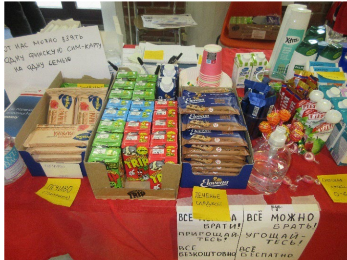
SPR jakaa saapujille välipalaa ja tarvikkeita.