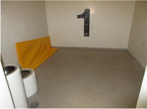
Kuva 2. Rauhoittamisvuoteen tila oli otettu normaaliin sellikäyttöön.

Oikeusasiamies piti hyvänä sitä, että rauhoittamisvuoteen käytöstä on luovuttu.