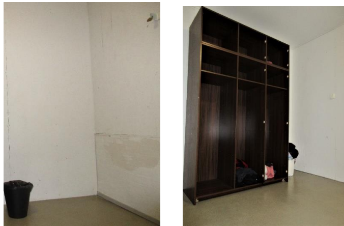
Banzai asukashuone tehopäätty 1 / "vanerihuone" / "vauvahuone"

Kartanon yläkerran eristämishuoneista lapsi siirtyi yleensä Banzai-yksikön tehopäättyyn huoneeseen 1, 2 tai 3. Lapset kutsuivat tehopäätty 1 huonetta "vanerihuoneeksi" tai "vauvahuoneeksi".