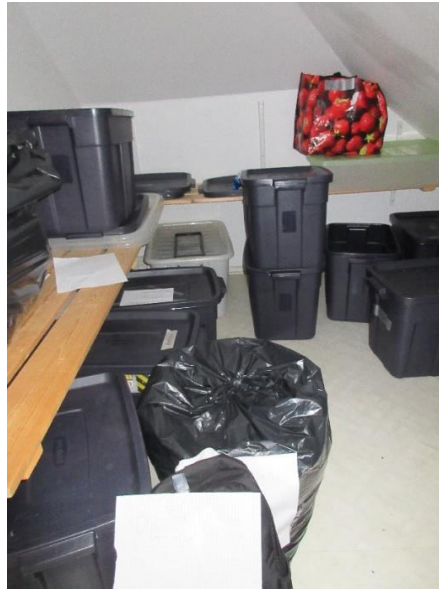
Lasten omaisuutta varastossa kartanon yläkerrassa

Tarkastuksella todettiin, että lasten tavaroita oli varastoitu Loikalan kartanon varastotiloihin. Tarkastajat kävivät laitoksen varastohuoneissa, joissa oli huomattava määrä lapsille kuuluvaa omaisuutta.