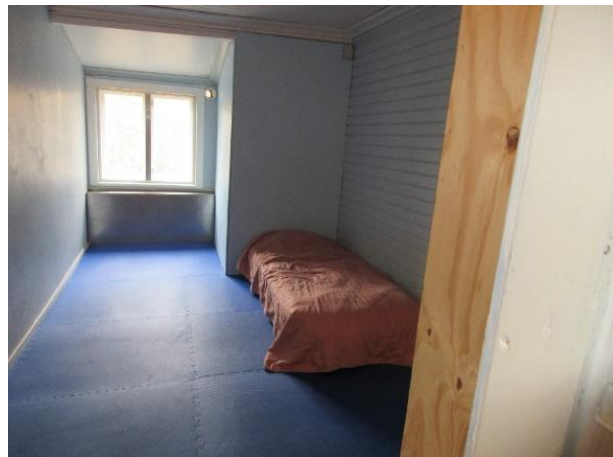
Ykköshuone / Erkka 1 huone

Loikalan kartano on aikaisemmin vuonna 2010 ilmoittanut, että ns. ykköshuone on sisustettu ”kodinomaisella tavalla olematta negatiivisesti poikkeava muista huoneista, vaan ennemminkin päinvastoin. Ykköshuonetta ei myöskään käytetä rangaistusluonteisena tai kurinpidollisessa merkityksessä pysäyttämismenettelyssä.”