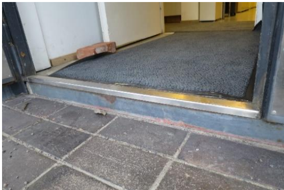
Kuva 5. ulko-oven korkea kynnyks

Äänestyspaikan ulko-ovi oli raskas ja kynnykset sisään pääsemiseksi olivat liian korkeita (ritilä n. 4 cm ja kynnyks n. 10 cm). Pyörätuolia käyttävä henkilö ei voinut suoriutua sisään omatoimisesti ilman toisen henkilön apua. Vaalitoimitsija totesi tarkastajille, että ulko-ovelle olisi tarpeellista hankkia luiska, joka mahdollistaisi liikuntaesteisten henkilöiden pääsyn äänestyspaikalle ja ylipäätään kirjastoon.