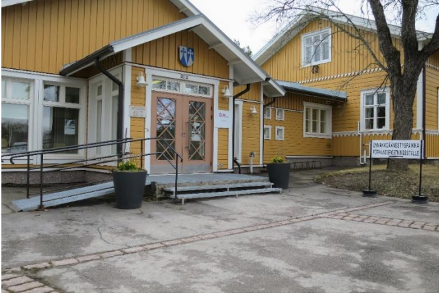
Kuva 9. Lapinjärven kunnantalon ennakoäänestyspaikka

Vaalitoimitsijoita oli kaksi, joista toinen hoiti tarvittaessa vaaliavustajan tehtäviä. Vaalitoimitsijoiden mukaan äänestäjät eivät olleet tarvinneet ulkopuolista apua äänestämässä. Saadun tiedon mukaan muutamia pyörätuolia käyttäviä henkilöitä oli käynyt äänestämässä, mutta he olivat pystyneet äänestämään omatoimisesti tavallisessa äänestyskopissa. Vaalitoimitsijoiden mukaan äänestystilasta ei ollut tullut negatiivista palautetta äänestäjiltä.