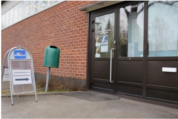
Kuva 8. opasteet ennakkoäänestyspaikalle

Ennakkoäänestyspaikkana toimiva kunnanvirasto sijaitsi Myrskylän keskustassa. Tämä oli ainoa ennakkoäänestyspaikka Myrskylässä. Virastotalon pihalla ei ollut erikseen merkittyä invapysäköintipaikkaa, muuten pysäköintitilaa oli varsin runsaasti. Virastotalon pihalla oli opasteet ennakkoäänestyspaikalle.