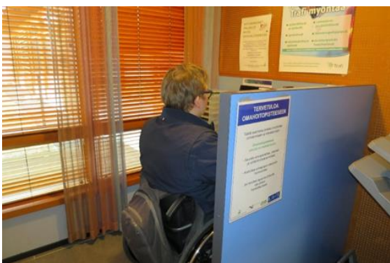
Kuva 7. esteetön äänestyspaikka

Äänestystilassa oli yksi tavallinen äänestyskoppi ja lisäksi palvelupisteen taakse ”omahoitopisteeseen” oli järjestetty esteetön äänestyspaikka liikkumisesteisille ja apuvälineitä käyttäville henkilöille. Äänestyspaikan kirjoitustaso oli sopivalla korkeudella pyörätuolin käyttäjälle ja näköyhteys äänestystapahtumaan oli suojattu riittävän korkealla sermillä. Ehdokaslistat olivat näkyvillä ”omahoitopisteen” kirjoituspöydän takaseinällä, mikä tarkastajien havaintojen mukaan oli tässä tilanteessa riittävää. Ennakoäänestyspaikalla ei ollut saatavilla suurennuslasia tai muuta vastaavaa apuvälinettä heikkonäköisiä äänestäjiä varten.