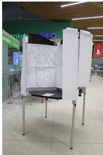
Kuva 2. esteetön äänestyskoppi

Ennakkoäänestyspaikalla ei ollut saatavilla suurennuslasia tai muuta vastaavaa apuvälinettä heikkonäköisiä äänestäjiä varten. Ennakkoäänestyspaikan valaistus oli riittävä. Marketin tiloissa oli tuoleja lepäämistä varten. Myös asianmukainen inva-wc löytyi äänestyspaikan läheisyydestä.