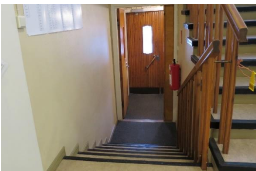
Kuva 10. esteellinen sisäänkäynti

Ennakoäänestyspaikka sijaitsi vanhassa Maaseututoimen puutalossa, jonka pääsisäänkäynti oli esteellinen. Ulko-oven jälkeen oli rappuset. Talon toisella sivustalla oli vaihtoehtoinen sisäänkäynti, jossa oli kivistä tehty luiska. Luiska oli kuitenkin niin jyrkkä, että siitä pääsi pyörätuolilla ylös vain avustettuna. Luiskan sivustoilla ei ollut käsijohteita. Vaalitoimitsijoiden mukaan henkilökunnan apua oli tarvittaessa saatavilla, jotta liikuntaesteinen henkilö pääsisi ennakoäänestyspaikalle.