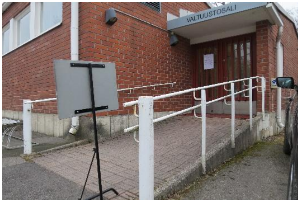
Kuva 3. Luiska sisäänkäynnille

Sisäänkäynnille johtava luiska oli melko jyrkkä pyörätuolia käyttävälle henkilölle. Lisäksi raskas ulko-ovi ja riittämätön tasanne ulko-oven edessä vaikeuttivat omatoimista sisäänpääsyä. Luiskan reunoilla oli asianmukaiset käsijohtimet.